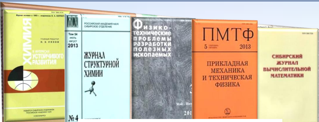
ИЗДАНИЯ СИБИРСКОГО ОТДЕЛЕНИЯ РАН

У науки имеется собственная специфическая логика развития, которую весьма важно учитывать. Наука всегда должна работать в запас, впрок, и только при этом условии она будет находиться в естественных для нее условиях. С. И. Вавилов